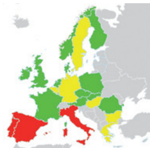
Figura 1. Mapa de los 20 países más poblados de la Unión Europea más Noruega. En verde figuran los países con un número suficiente de Anexos Nacionales que permite un uso de los Eurocódigos para la mayoría de aplicaciones, en amarillo figuran los países que han empezado ya la publicación de algunos de los Anexos y en rojo figuran los países que no han publicado ninguno. Fecha de análisis: abril/junio de 2010. | Mapa dels 20 països més poblats de la Unió Europea més Noruega. En verd figuren els països amb un nombre suficient d'Annexos Nacionals que permet un ús dels Eurocodis per a la majoria d'aplicacions, en groc figuren els països que han començat ja la publicació d'alguns dels Annexos i en vermell figuren els països que no han publicat cap. Data d'anàlisi: abril/juny de 2010.